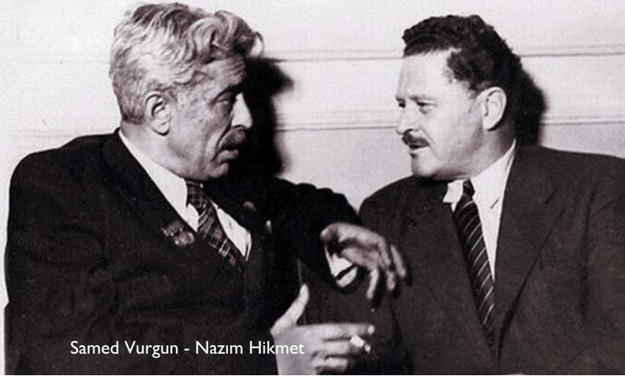
Samed Vurgun - Nazım Hikmet

Şair bir babanın oğlu olan Vagif, bu sayede zamanın en ünlü şairleriyle birarada olmak şansına erişmişse de, geçen günler gösterdi ki, bütün bu ünlü şairler de Vagif'le birarada olma şansını yaşamışlardır. Vagif Samedoğlu bir şairin oğlu olmasına karşın, kendi özgün biçimini yaratmıştır.